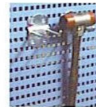
KOD NO. OK-04 Takım Asma Kancası