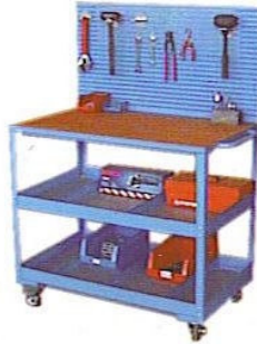
KOD NO. SA-04 Hareketli Çalışma Tezgahı