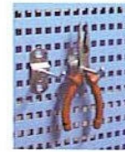
KOD NO. OK-02 Takım Asma Kancası