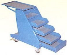
KOD NO. SA-01 Servis Dolabı