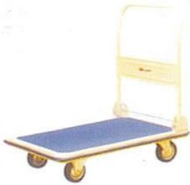
KOD NO. SA-05 Parça Taşıma Arabası