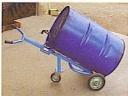
KOD NO. SA-07 Bidon Taşıma Arabası