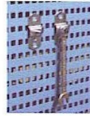
KOD NO. OK-01 Takım Asma Kancası