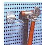
KOD NO. OK-06 Takım Asma Kancası