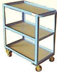
KOD NO. SA-02 Servis Arabası