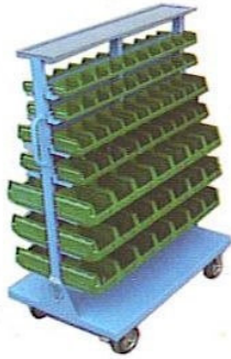
KOD NO. SA-03 Hareketli Avadanlık Sehpası