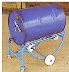
KOD NO. SA-08 Bidon Başaltma Arabası